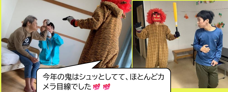
今年の鬼はシュツとして、ほとんどカメラ目線でした 100 100