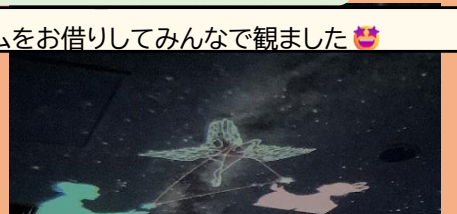
プラネタリウムをお借りしてみんなで観ました🌟